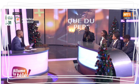
Passage télé dans l'émission "Allume la télé" sur RTI 1 le 13 décembre 2023

Notre fierté est grande, et nous sommes davantage motivés à engager nos élèves dans des compétitions internationales de haut niveau.