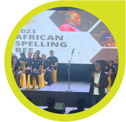
Image de la compétition à Kampala, Ouganda

Sur au total 15 pays présents en Ouganda, la Côte d'Ivoire s'est hissée parmi les 5 meilleures nations à la Grande Finale.